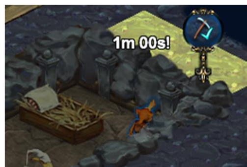
Goblin podczas pracy

W międzyczasie budowa kuchni również została ukończona. Teraz wystarczy już tylko urządzić miejsce do gotowania i nasz pierwszy goblin kucharz już zaczyna dla wszystkich pichcić pyszną zupkę.