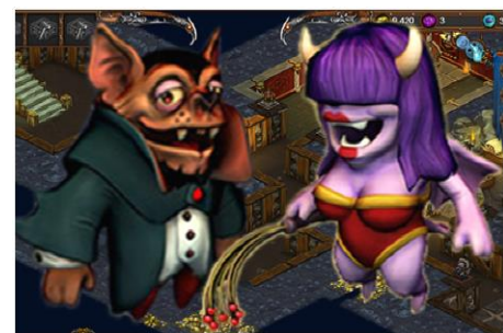
Wampir i sukkubus

A co robią wampiry i sukkubusy tego jeszcze Wam w tym miejscu nie zdradzimy.